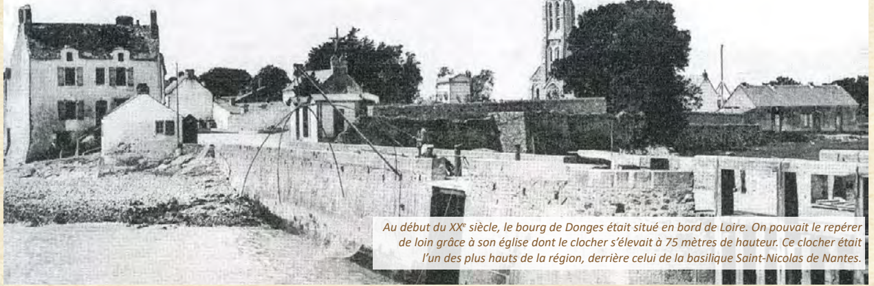
Au début du XX e siècle, le bourg de Donges était situé en bord de Loire. On pouvait le repérer de loin grâce à son église dont le clocher s'élevait à 75 mètres de hauteur. Ce clocher était l'un des plus hauts de la région, derrière celui de la basilique Saint-Nicolas de Nantes.