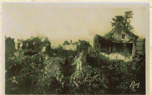
Carte postale représentant l'ancien bourg de Donges bombardé. Édition Rosy - Collection privée Fabrice TRIPON