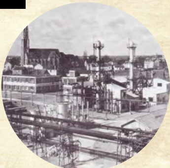
En 1917, la COPP (Companie Occidentale des produits pétroliers) installe ses premiers réservoirs d'hydrocarbures à l'ouest du bourg de Donges, et construit des appointements en Loire pour l'accostage des pétroliers. En 1932, une première unité de raffinage voit le jour près des dépôts, marquant le début de l'industrialisation de Donges.

C'est cette tragédie des bombardements qui fut ensuite à l'origine du déplacement du bourg vers le centre-ville actuel. Dix ans plus tard, le 4 juillet 1954, le Président du Sénat Gaston MONNERVILLE vint à Donges pour inaugurer la nouvelle mairie et remettre la croix de guerre à la Ville, officialisant la renaissance de Donges après les terribles épreuves de l'été 1944.