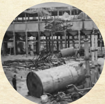
Photo de la raffinerie détruite après les bombardements de juillet 1944.